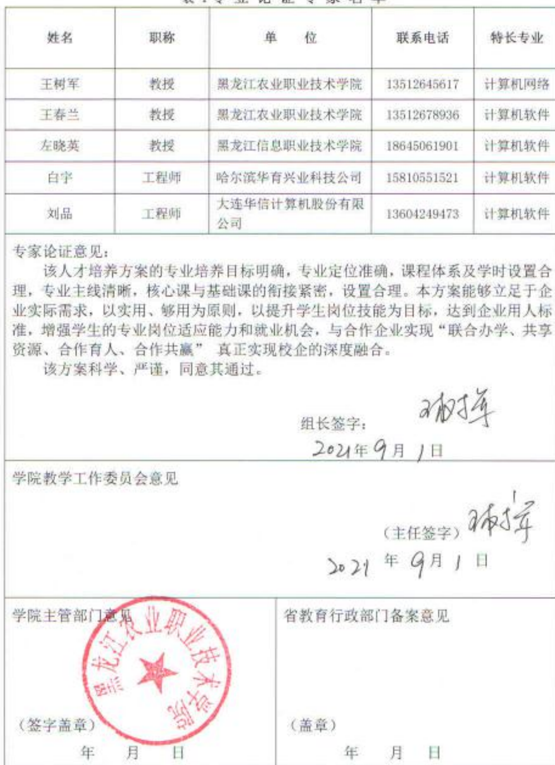
表1 专业论证专家名单